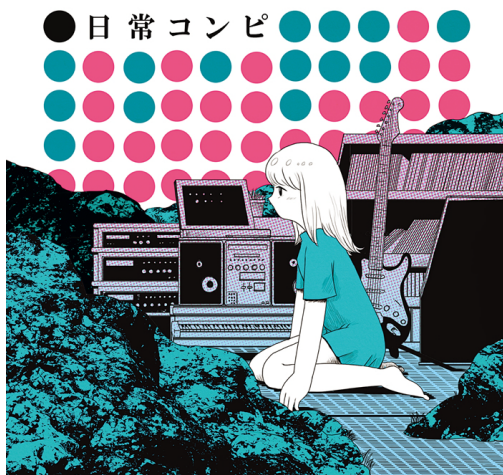
on sunday recordings「日常コンピ」ジャケット

最近では、現代のイラストレーター150名を紹介する書籍「ILLUSTRATION 2014」(翔泳社)への掲載、歌謡エレクトロユニット「サテライトヤング」へのジャケットイラスト提供、日常系電子音楽ネットレーベル「on sunday recordings」のアルバム「日常コンピ」のジャケット、フライヤーデザインなど活動の場を広げつつあります。