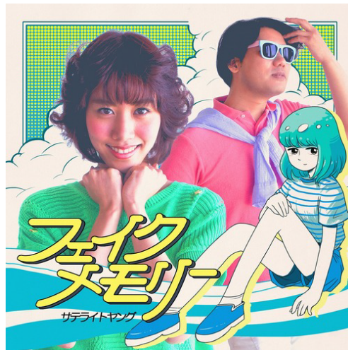
サテライトヤング「フェイクメモリー」ジャケット