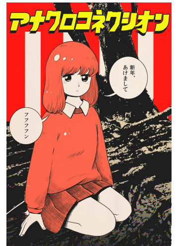
ラウンジイベント 「アナクロコネクション」フライヤー