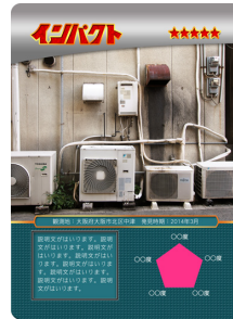
トレーディングカードの 制作段階イメージ

エアコン配管トレーディングカードやオリジナルTシャツなど、ユニークな関連グッズを多数販売予定です。