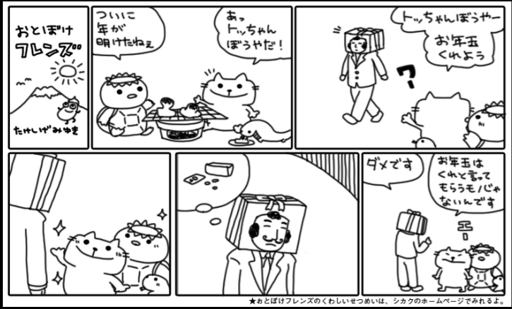
★おとぼけフランスのくわいせつめいば、シカクのホームページでみれるよ。

を開催中！かつて時代を築いたベテランから新進気鋭の若手作家まで、22名の漫画作品を収録し先月発売した「総合マンガ誌第六号」の原画作品展示や、一部作家の個人誌・サイン本等の販売を行っております。年末に前半、年始に後半という感じで、コレを読んでいる皆さんが来るとしたら後半の方になると思いますので、自分へのお年玉ということで是非遊びに来てね。そして来年の初めの方は、確定申告にすべてを捧げるので何も企画はありません！でも春頃からはまた素敵な催しをいくつも企んでおりますので、どうぞお楽しみに！2015年もシカクをどうぞよろしくお願ひいたします。